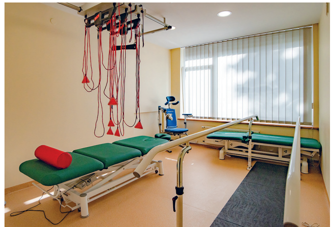
Pažangus kineziterapijos kompleksas skirtas pacientams po įvairių traumų