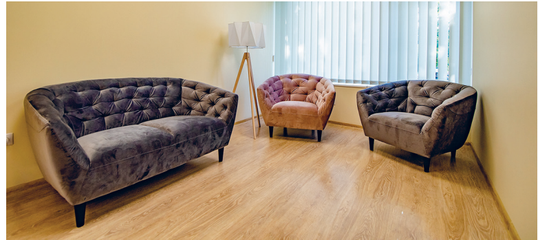
Baigiamas įrengti individualios ir grupinės psichoterapijos kabinetas

VšĮ LR Vidaus reikalų ministerijos poilsio ir reabilitacijos centre „Pušynas“ kasmet reabilitaciniam gydymui atvyksta apie 2300 pacientų. Sveikatos įstaigoje teikiamos 45 skirtingų rūšių procedūros.