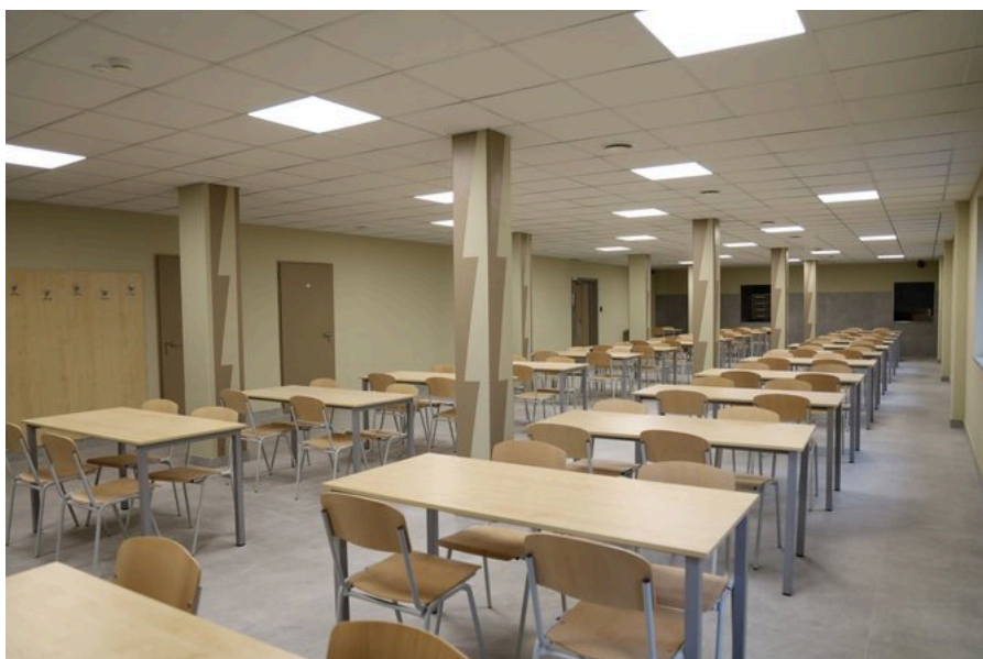
Pabradės užsieniečių registracijos centro rekonstrukcija ir statyba

Projekto įgyvendinimo metu nuo 2019 m. jau įvykdyti kiti URC rekonstrukcijos ir statybos darbai: pastatytas sulaikytų moterų bendrabutis, užsieniečių priėmimo pastatas, rekonstruotas administracinis pastatas bei pastatytas jo priestatas, rekonstruoti garažo, valgyklos, sandėlių pastatai, pastatyti voljerai tarnybiniams šunims, URC teritorija aptverta nauja tvora, įrengti lauko inžineriniai tinklai, nugriauti seni ir nefunkcionalūs pastatai, sutvarkyta aplinka. Taip pat nupirkta reikalinga įranga ir baldai rekonstruotuose ir naujai pastatytuose pastatuose.