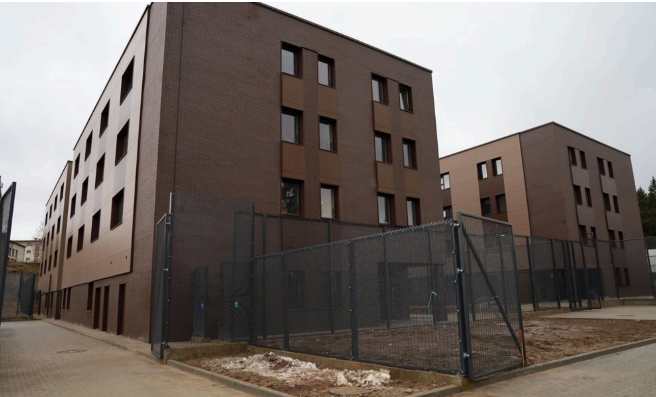
Pabradės užsieniečių registracijos centro rekonstrukcija ir statyba

Gruodžio 20 d. Užsieniečių registracijos centre (URC) Pabradėje duris atvėrė Migrantų multifunkcinis centras – du nauji ir modernūs pastatai užsieniečių apgyvendinimui.